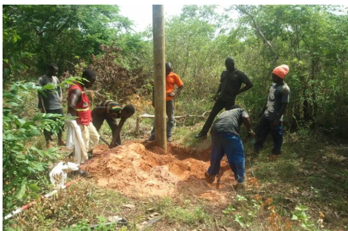
En een foto van de palen op het schoolterrein

Al eerder waren er signalen dat er iets zou gebeuren, maar nu zijn de voorbereidingen in volle gang: langs 1½ kilometer zijn de palen geplaatst, zoals op bijgaande foto's is te zien. Nu nog die 220V!