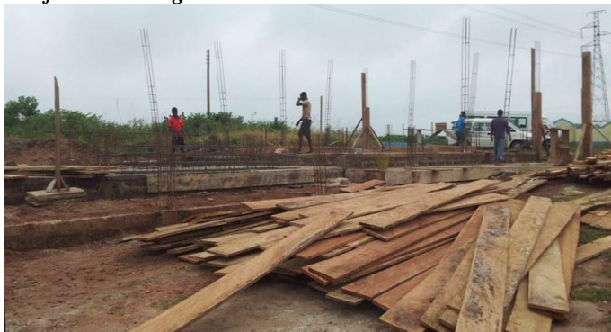
De vloer is klaar; de kolommen worden bewapend en bekist