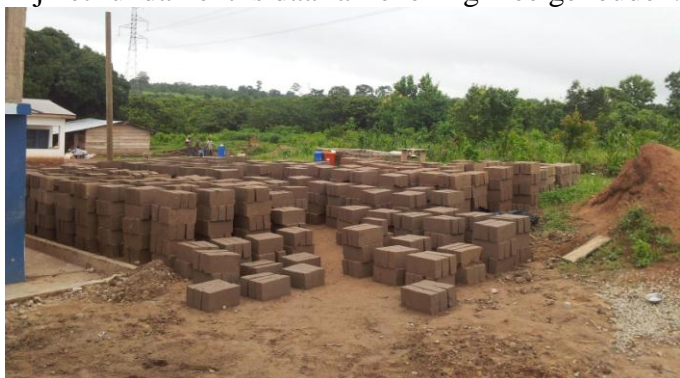
De stenen liggen alvast te drogen

De bouw is voortvarend van start gegaan, de stenen zijn ter plaatse gemaakt; het fundament is al gelegd. Door de sterke groei van de school is het op den duur nodig om klaslokalen op de kantine te zetten. Bij het fundament is daar al rekening mee gehouden.