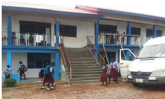
Extra trap aan de voorzijde van de school

De onderwijsinspectie wilde een extra trap om de boven-etage snel te kunnen ontruimen. Mooi is anders. Nu nog tegels en verfje.