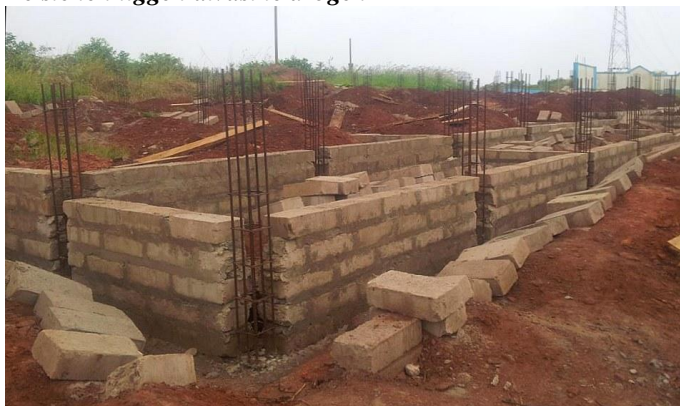
Het fundament ligt er. Nu komen de vloeren en kolommen