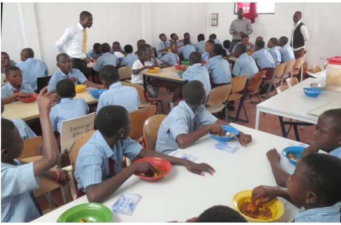
de dining hall in vol bedrijf