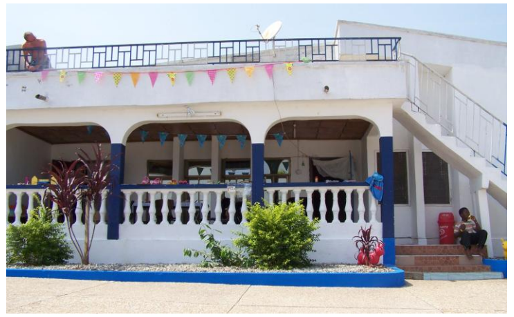
Kids Palace (Nursery & Day Care)