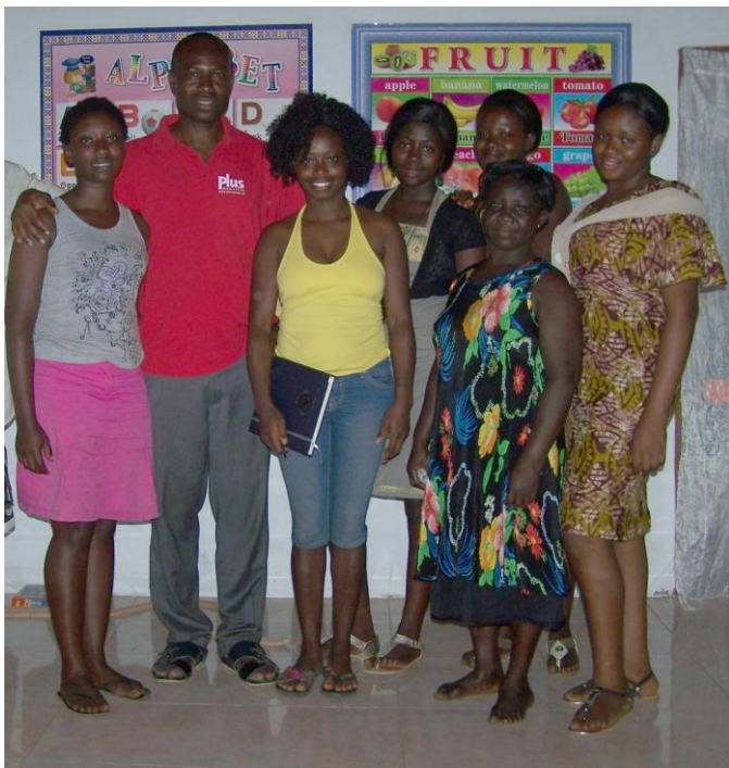
de nieuwe kleuterjuffen van Kid's Palace met de directie