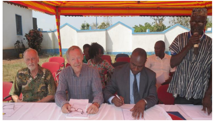
Belira, de directeur en de voorzitter van het oudercomité.