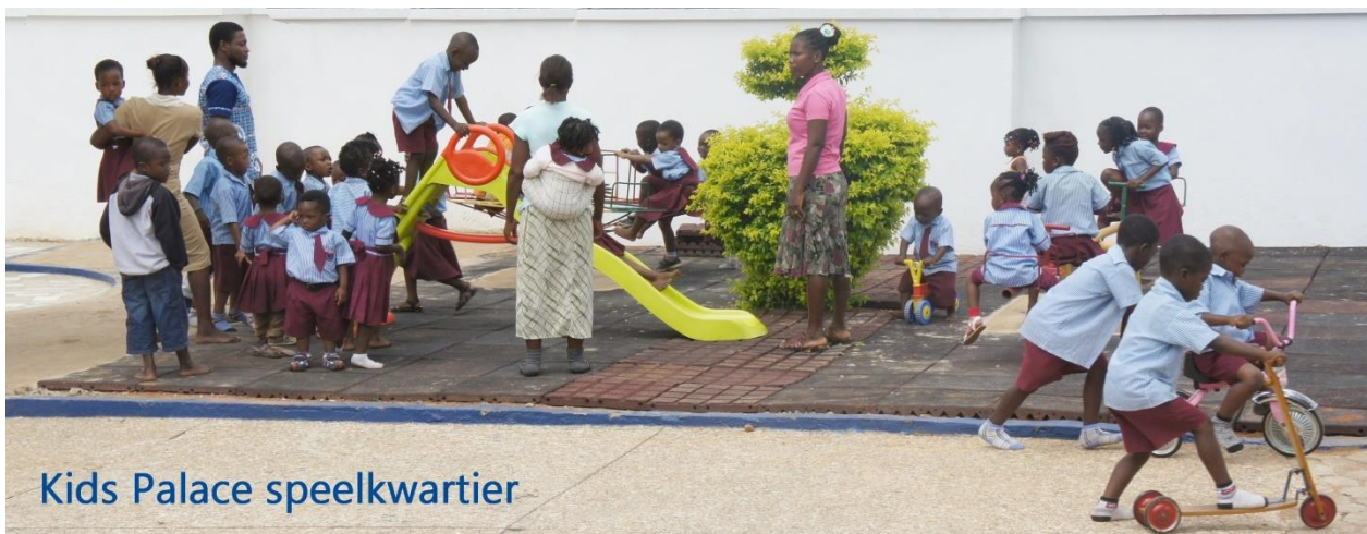
Kids Palace speelkwartier