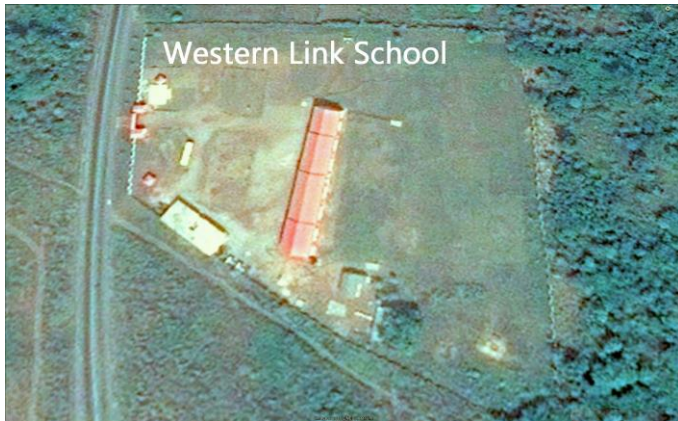
Een satellietbeeld van de school en de compound.

Nog even wat feiten: De school kent drie afdelingen: in Wenchi het Kids Palace met een Nursery en Kinder-garten (1 + 2) met totaal 240 kinderen, dan (op 6 kilometer van Wenchi) de Primary School (groep 1 – 6) met 12 klassen en de Junior High (groep 1 – 3) met 5 klassen met totaal 436 kinderen op een groot ommuurd terrein aan de Wenci-Techiman road.