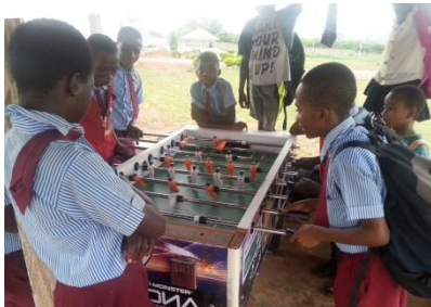
Kotschool-gangers aan het tafelvoetballen.

Internaat: In het gebouw met het witte dak zijn de eetzaal en het boarding house gevestigd. Van de 436 leerlingen verblijven er 86 op deze kostschool. Het zijn vooral de kinderen van de Junior High die door