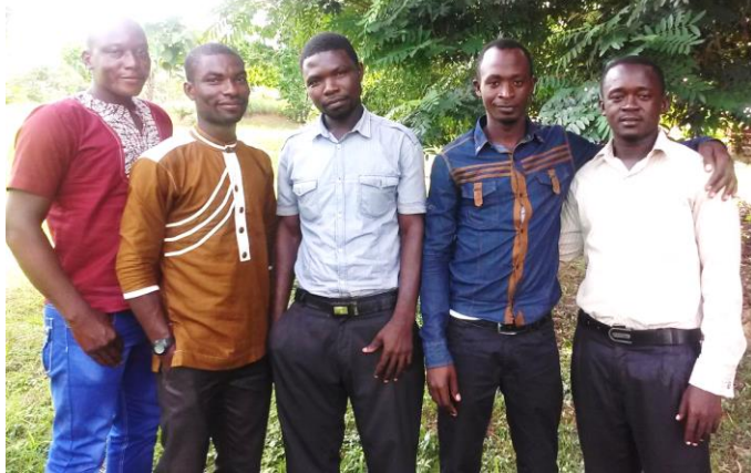
Docenten-team dat onze kandidaten klaarstoomt voor het examen.

De stichting BELIRA heeft de school van meet af aan gesteund. Zo'n school past in de doelstelling van armoedebestrijding, geeft kinderen kansen op vervolgonderwijs en door de "scholarships" kunnen 40 kinderen toch ook naar deze "dure" school. Voor het voortbestaan van de school is de naam van de school heel belangrijk. Het probleem is om voldoende kinderen te werven en te houden. Onderwijzers zijn er genoeg en na vijf jaar hebben we de beste behouden en de minder goede laten vertrekken. We vertelden al dat we door de inspectie als de beste school in de regio zijn uitgeroepen. Dat komt onder andere doordat de kinderen slagen voor hun toelatingsexamen voor het vervolgonderwijs; de Senior High, het MBO van Ghana. Daarom heeft de school vanaf nu verplicht gesteld om het laatste semester op het Internaat te zitten. Daar krijgen ze 's avonds extra les en zijn ze vrij van huishoudelijke taken zoals boodschappen doen, schoonmaken, meehelpen met de oogst of op de kleintjes passen.