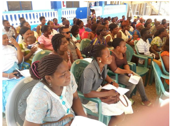
De ouders op de PTA vergadering waar het bankschandaal druk besproken werd

Veel ouders deden mee stelden de betaling van het schoolgeld uit. Nu zijn ze al hun spaargeld kwijt en kunnen het schoolgeld niet betalen. Hoeveel ouders gedupeerd zijn is niet duidelijk. Velen schamen zich maar op de PTA (oudervergadering) staken toch veel mensen eerlijk hun hand op toen dat gevraagd werd.