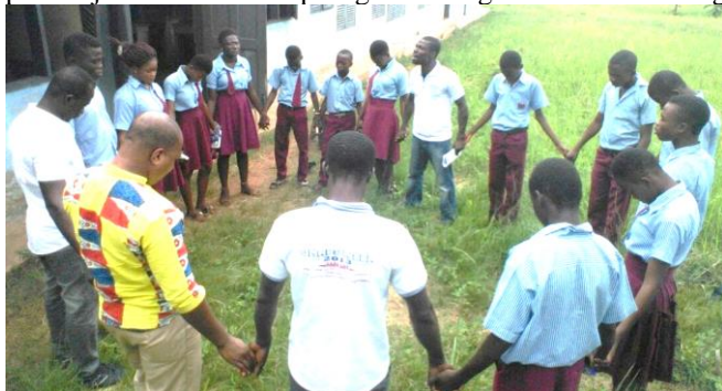
Hier bidden de 13 kandidaten samen met hun leraren voor hun examen