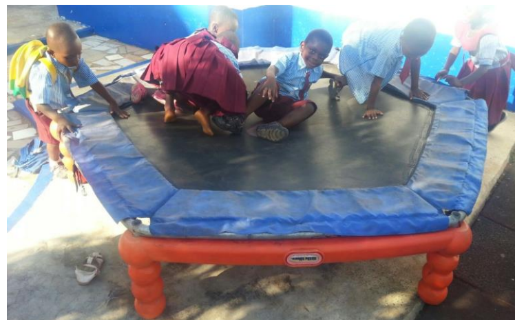
De oude trampoline van onze burens is favoriet bij ons Kids Palace.

1e lustrum Schoolfonds: Dit najaar bestaat het schoolfonds vijf jaar; we begonnen in september 2011 met 10 sponsors en we hebben er nu 26, dat zijn jullie dus!! Door jullie bijdragen kunnen zo'n 40 arme kinderen toch naar deze (relatief dure maar goede) particuliere school. Ook de Nieuwsbrief, die jullie een aantal malen per jaar krijgen bestaat nu 5 jaar. Het eerste exemplaar rolde in november 2011 van de persen.