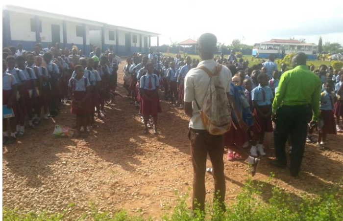
De wekelijkse ochtend bijeenkomst.

Één keer per week worden alle leerlingen samen met alle docenten bijeengeroepen op het plein voor de school waar het schoolhoofd vanaf de trap ( te zien op de kopfoto ) alle noodzakelijke (nieuws)–mededelingen doet. Dit zijn de zgn. assemblies. De boys– en girls prefects, zelf leerlingen, zorgen voor orde en rust. Hier komen o.a. wijzigingen in het rooster, werkzaamheden in of aan de school, etenskwesaties en absentie aan bod. De kinderen vinden het altijd erg spannend te horen wat er allemaal aan nieuws gemeld wordt.