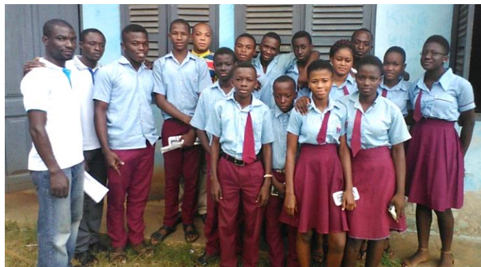
Trotse docenten met onze 13 kampioenen.

Eindexamen: In de vorige Nieuwsbrief werd al gemeld dat de eindexamenleerlingen het goed hadden gedaan, maar dat nog gewacht moest worden op de uitslagen. Toen die maar uitbleven, werd geïnformeerd bij de landelijke examencommissie. Nu bleek, dat alle 13 leerlingen voor één vak (Science) een 10 hadden, en dat werd niet vertrouwd. Ook in alle andere vakken scoorden onze studenten zeer hoog. Het schoolhoofd en een docent gingen voor overleg naar het ministerie (een dagreis). Hoewel de inspectie geen onregelmatigheden kon aantonen – de examenzaal stond zelfs onder politieursurveillance – werden alle cijfers voor Science verlaagd naar een 7. Heel onrechtvaardig, maar de leerlingen konden hiermee wel naar het vervolgonderwijs, en dat was het voornaamste. De intensieve coaching van deze leerlingen door de leraren ook na schooltijd heeft dus wel zijn vruchten afgeworpen. Volgend jaar proberen we het weer!