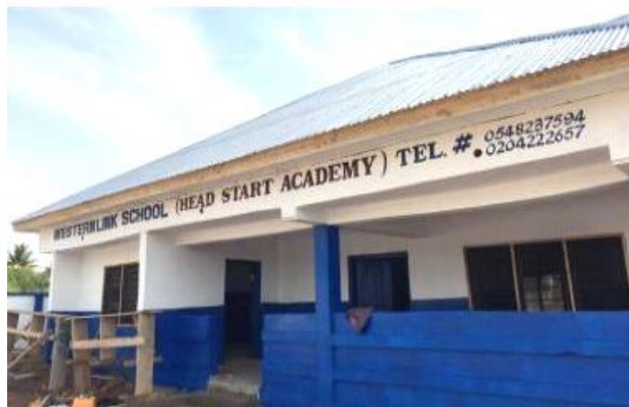
Het verwaarloosde pand is zo snel mogelijk opgeknapt.

U heeft lang moeten wachten op deze nieuwsbrief. De communicatie was mager omdat de school leeg was en stil stond. De berichtgeving ging dan ook met horten en stoten. Ik wijs jullie er op dat het nieuws wel regelmatig wordt bijgehouden op onze site Belir.org. Klik in ons hoofdmenu op "NIEUWS" om tussen de nieuwsbrieven door (drie per jaar) op de hoogte te blijven. De rest van deze pagina gebruiken we nu voor de nieuwste plattegrond (foto april 2020) van Western Link.