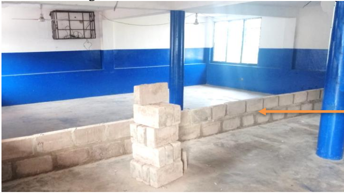
gelukkig is er veel ventilatie met fans en staan ramen altijd open.

Klassen met 60 of meer kinderen kwamen we wel vaker tegen. Wij stelden het maximum op 40. Door Corona heeft de overheid ineens normen gesteld: de klassengrootte is nu ineens volgens landelijk voorschrift 24 maximaal! We moeten de grotere lokalen nu in tweeën delen.